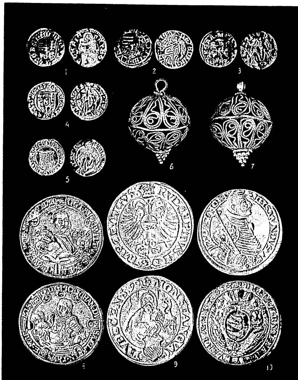
Fig. 1. — Stăuceni. Monede (1, de la Matei Corvin; 2 — 3, de la Vladislav al II-lea; 4, de la Ludovic al II-lea; 5, de la Ferdinand I; 8, de la Frederic-Wilhelm I asociat cu Johann; 9, de la Rudolf II; 10, de la Sigismund Báthory) și nasturi (6, 7) de argint.