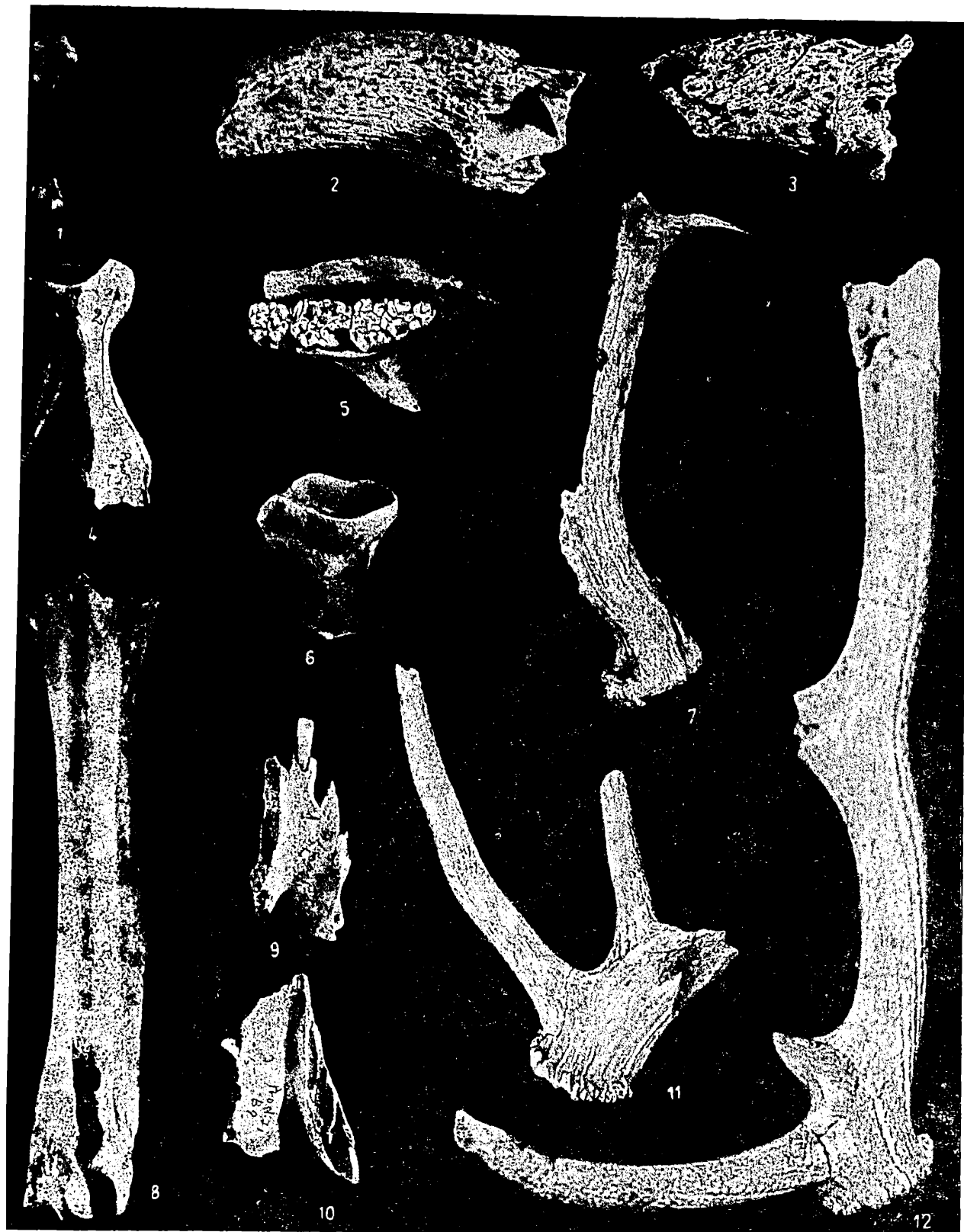
Fig. 1. — Oase de animale domestice ( Gallus domesticus ; humerus, 1; Bos taurus ; fragmente de coarne, 2, 3; metatars de mascul castrat, 8; Sus scrofa domestica ; fragmente de omoplat, 4 și de maxilar superior, 5; regiuni simfizare ale mandibulei, 9, 10) și sălbatice ( Sus scrofa ferus ; fragment de omoplat, 6; Capreolus capreolus ; corn fragmentar, 7; Cervus elaphus ; coarne fragmentare, 11, 12).